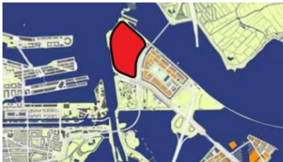
Figuur 1: ligging Sluisbuurt op Zeeburgereiland

De Sluisbuurt is een nieuw te ontwikkelen wijk in Amsterdam. De Sluisbuurt is onderdeel van de IJoevers en ligt in het noordwestelijke deel van het Zeeburgereiland, nabij de Oranjesluizen. Het Zeeburgereiland verbindt het Oostelijk Havengebied met Amsterdam-Noord. Het eiland ligt in het Buiten-IJ, Zeeburg en Mond van het Amsterdams Rijnkanaal. De locatie aan het waterfront van de Sluisbuurt kijkt uit over het IJ en de binnenstad. De Sluisbuurt is gelegen binnen de ring A10 en via de Piet Heintunnel fysiek verbonden met het centrum van Amsterdam. In de Sluisbuurt worden in een relatief beperkte ruimte ruim 5.500 woningen en circa 100.000 m 2 voorzieningen gerealiseerd. De wijk wordt opgebouwd uit clusters die weer bestaan uit verschillende bouwblokken en kavels.